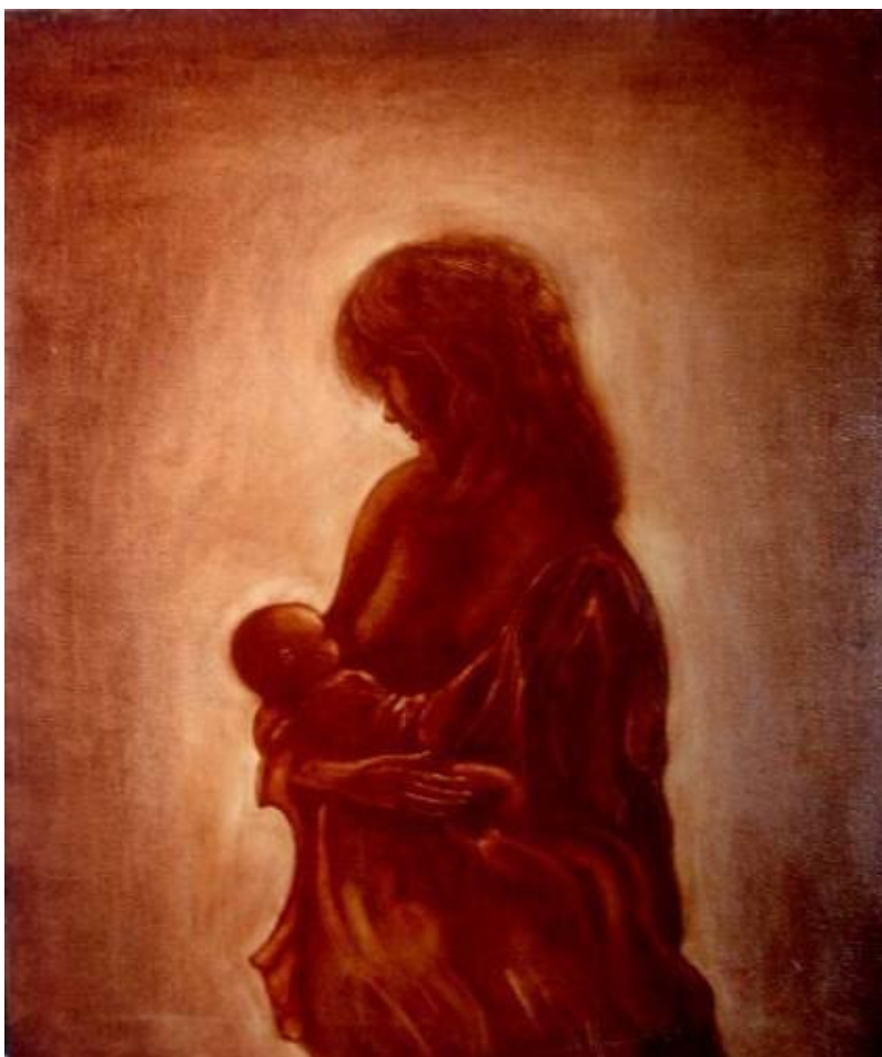
MAZZACANI GIANCARLO mamma con bambino 2